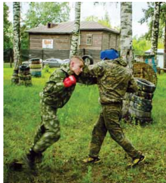
Испытания на право ношения зеленого берета