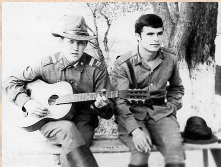
В минуты отдыха

Среди первых испытаний были инспекторская проверка Главного управления Пограничных войск КГБ СССР, по итогам