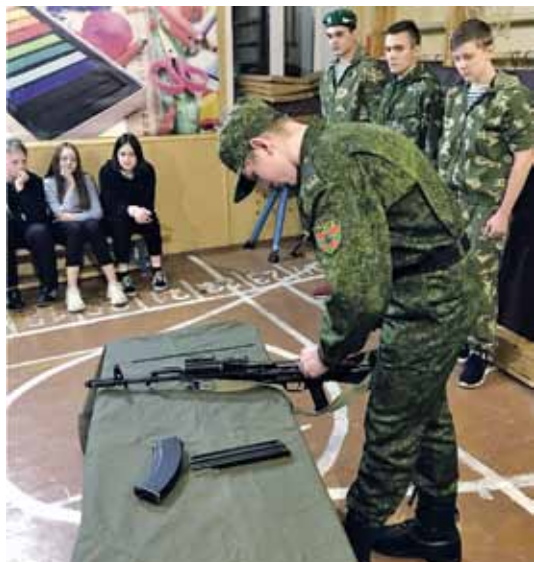
Показательные выступления в одной из школ города

пограничных войск, третий — по медицинской подготовке. Дополнительные вопросы могут задать члены экзаменационной комиссии, в состав которой входят представители Кировской региональной общественной организации пограничников «Граница».