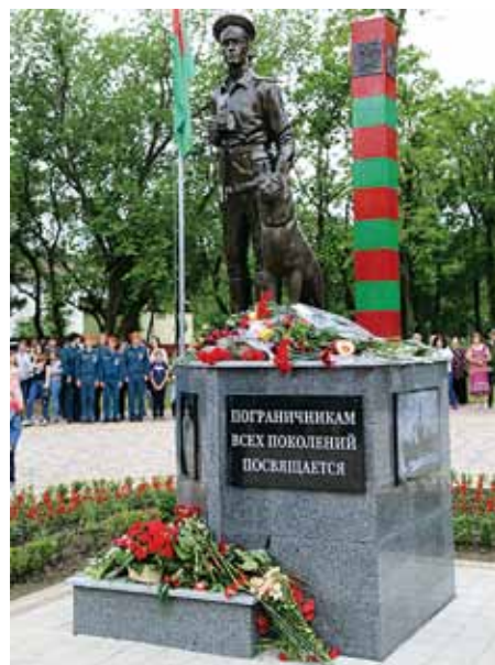
Памятник пограничникам в Армавире