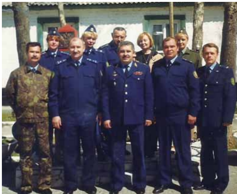
В Душанбинском авиаполку