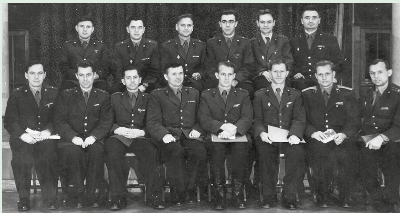
Участники сборов помощников начальников политотделов пограничных округов по комсомольской работе, 1960 год

Все это позволило уже к 1975 году довести некомплект кадров до 5,4%, но их качественный состав оставался низким — 35%