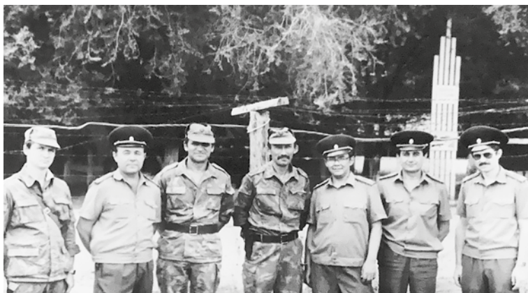
В полевом учебном центре Алма-Атинского высшего пограничного командного училища. 1989 год

но и постановлений правительства, приказов министерств, а на все это требовалось время. Одновременно шел поиск кадров на местах. Нужны были принципиальные, юридически грамотные, умеющие защищать закон люди.