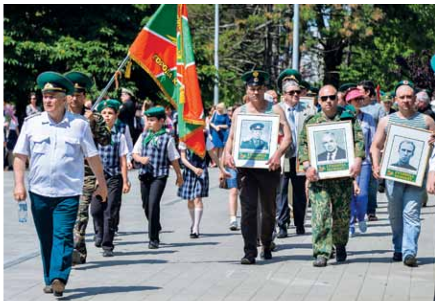
Торжественное шествие по улицам Краснодара «Граница помнит...»

С декабря 2020-го по март 2021 года проходил I этап Ежегодного краевого конкурса оборонно-массовой и военно-патриотической работы памяти маршала Г.К. Жукова. Ветераны-пограничники организовали почти 500 мероприятий, охвативших около 12 тысяч человек.