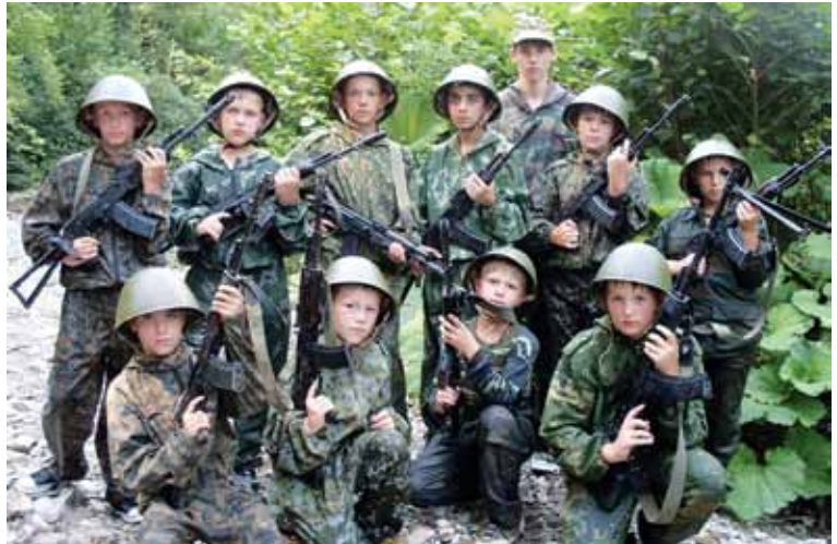
Отряд ЮДП города Сочи на занятиях