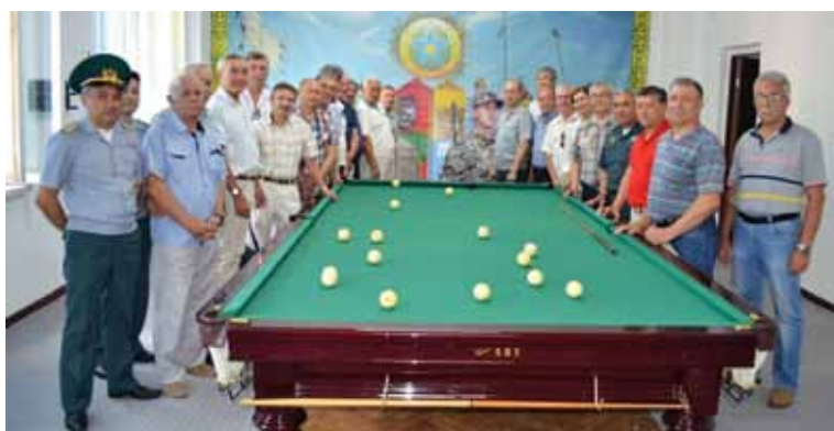
Клуб ветеранов-пограничников. Алматы, 2019 год