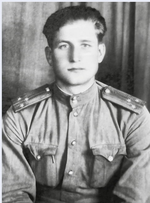
Начальник 11-й заставы 19-го отряда Молдавского пограничного округа. 1952–1953 годы