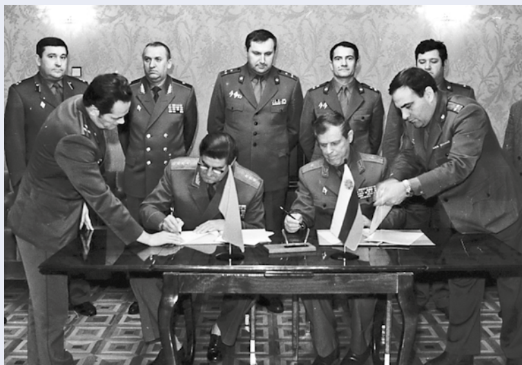
Подписание соглашения с болгарскими пограничниками. 1990 год

Активная новаторская деятельность Ильи Яковлевича была замечена, и в июле 1985 года его назначили начальником штаба Пограничных войск КГБ СССР. «Обладает развитыми организаторскими способностями и волевыми качествами, в сложной обстановке на границе