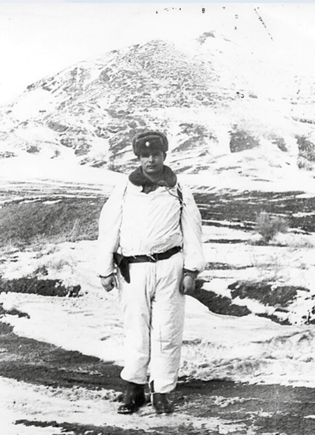
В Ленкоранском пограничном отряде. 1980-е годы

станций позволяли его обнаружить. Проконсультировались с метеорологами и специалистами по РЛС и выяснили, что в конкретных погодных условиях фактическая дальность действия РЛС была снижена. Поэтому посты технического наблюдения буксир «Шторм» видеть не могли!