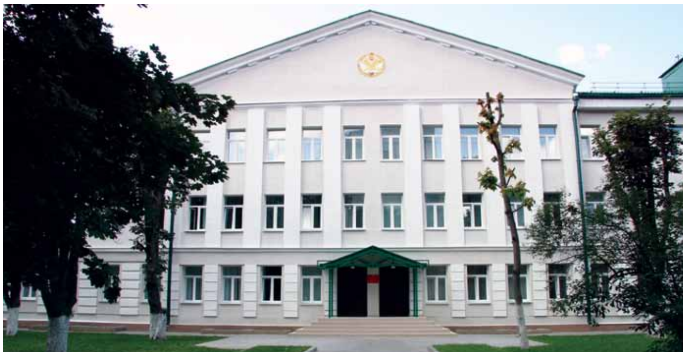
Белорусский Институт пограничной службы