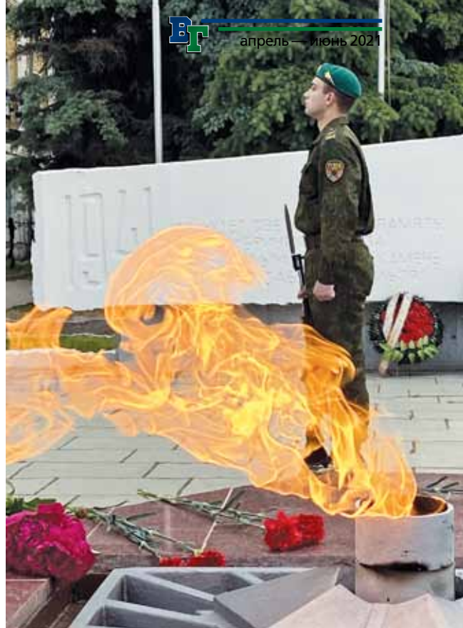
Почетный караул у Вечного огня. Киров, 22 июня 2020 года