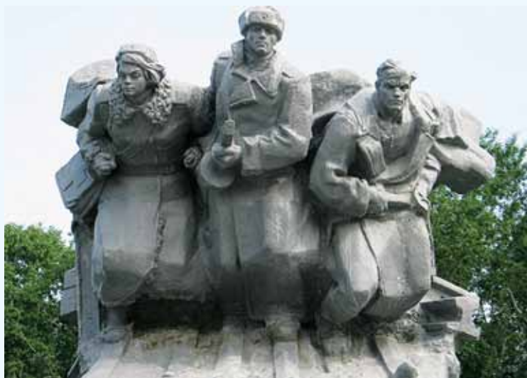
Памятник воинам-спортсменам Урала — участникам Великой Отечественной войны в Екатеринбурге