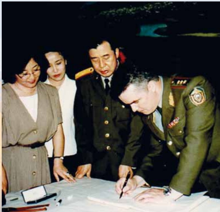
Встреча с китайскими коллегами