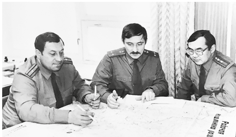
Слушатели Высших пограничных командных курсов КГБ СССР. Москва, 1986 год

Сложно ли было юристам в те годы? Да. Следовало вникнуть в суть содержания огромного количества не только законов,