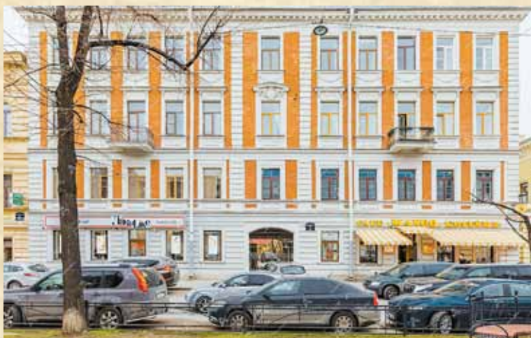
Дом на улице Фурштатской, 50, в Санкт-Петербурге, где жила семья Лесковых

Николай Лесков умер в Петербурге 5 марта 1895 года. Похоронен на Волковском кладбище.