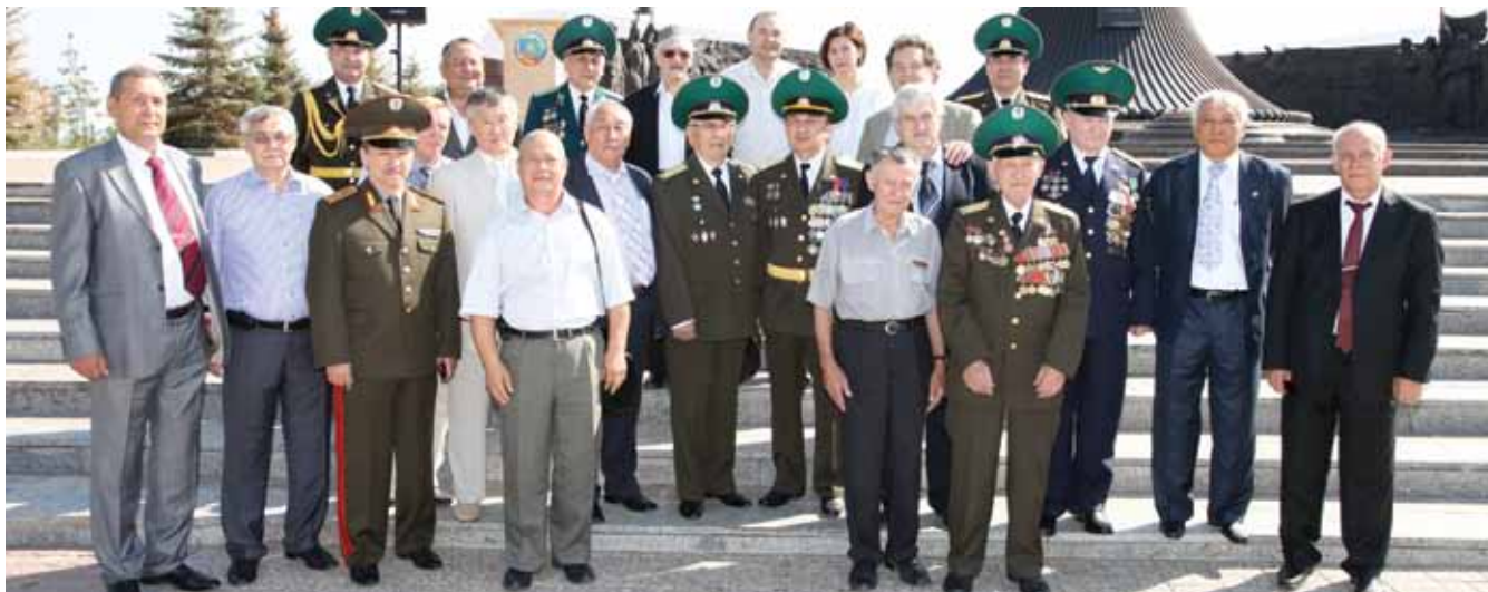
Алматинские ветераны на 20-летию Пограничной службы КНБ Республики Казахстан. Астана, 2012 год