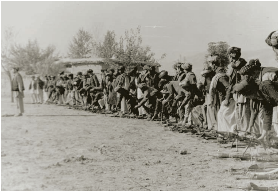
Переход бандгруппы Размамада на сторону народной власти

Весь комплекс проведенных мероприятий позволил мне, как начальнику ММГ, быстро вписаться в обстановку, правильно планировать служебно-боевую и повседневную деятельность, руководить ММГ в различных условиях обстановки.