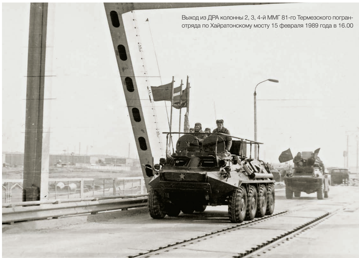
Выход из ДРА колонны 2, 3, 4-й ММГ 81-го Термезского погранотряда по Хайратонскому мосту 15 февраля 1989 года в 16.00

В этот день мне не удалось попасть домой. После короткой передышки мы выдвинулись в районы предназначения. Началась новая жизнь по прикрытию государственной границы, но уже с советской территории. Вот так и завершилась моя эпопея по выполнению интернационального долга на территории Республики Афганистан.