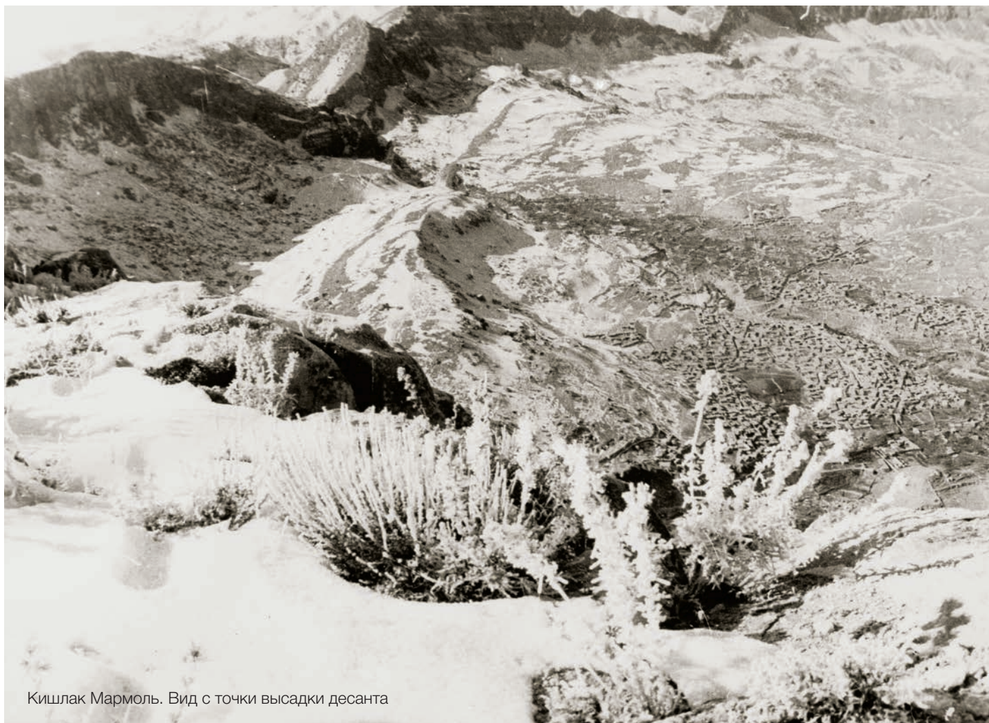
Кишлак Мармоль. Вид с точки высадки десанта

Проведя значительную предварительную подготовку, с учетом проведенной накануне аэрофотосъемки, разведки района агентурой, 21 января 1984 г. до часу дня все подразделения и части, участвующие в операции, заняли исходные позиции. Десантированные группы тоже приблизились на огневую дистанцию к своим объектам, а также перекрыли пути