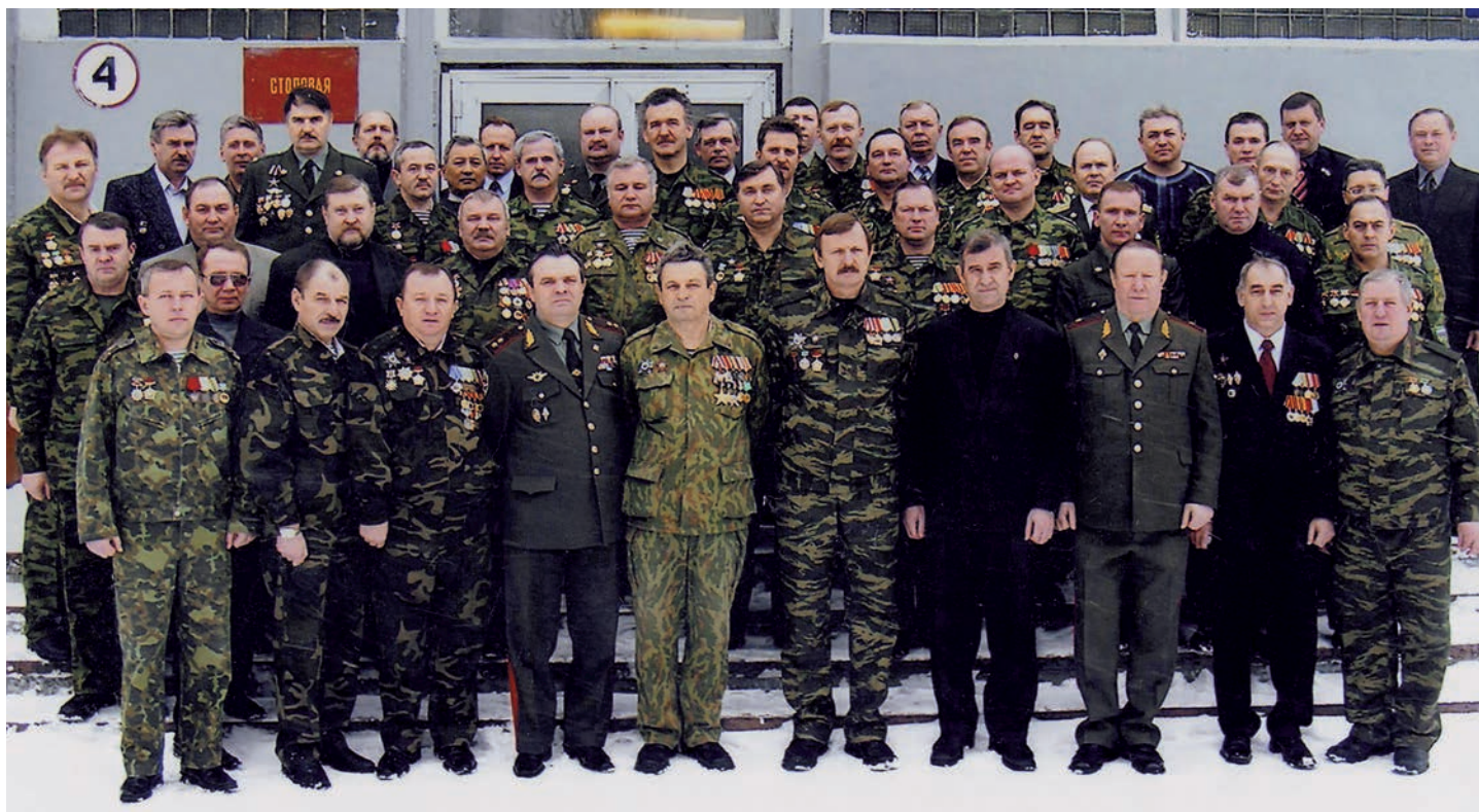
«Воронежские «афганцы». Встречи боевых побратимов стали традиционными в день вывода войск из Афганистана, 2002 г.