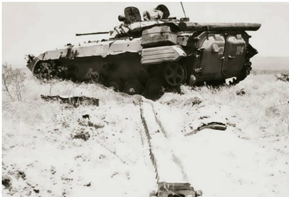
БМП, подорвавшаяся на mine

На высоте мы для них были практически неуязвимы. Были, конечно, попытки нанести по нам удар, но нам предоставлялась возможность опережать противника. Тактика обычная: поражаем передние и последние машины, а дальше долбим всю технику, которая встала посредине. Установка «Град» за 5 дней выпустила более 500 реактивных снарядов. Об этом я, естественно, докладывал в от-