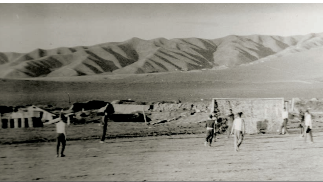
Минуты отдыха, занятие спортом. 3-я ММГ, к. Чахи-Аб Тахарской провинции