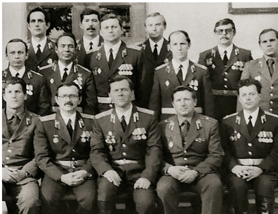
Руководители Ашхабадского госпиталя с начальниками лечебно-диагностических кабинетов и отделений, 1988 г.

К сожалению, многие материалы, связанные с проведением боевых операций и их медицинским обеспечением, были в свое время уничтожены. Но благополучно доставлены на ответственное хранение в Центральный пограничный архив ФСБ России истории болезни всех пациентов, находившихся на лечении в Ашхабадском госпитале по 1991 год. Так что прошу всех исследователей медицинских потерь и побед использовать эту информацию для анализа и дальнейших научных изысканий. Каждая история болезни того периода – отражение огромного врачебного опыта, который накапливался в сложнейшей боевой и медицинской обстановке.