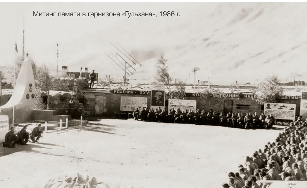
Митинг памяти в гарнизоне «Гульхана», 1986 г.

Таким образом, была создана цельная система партийно-поли-