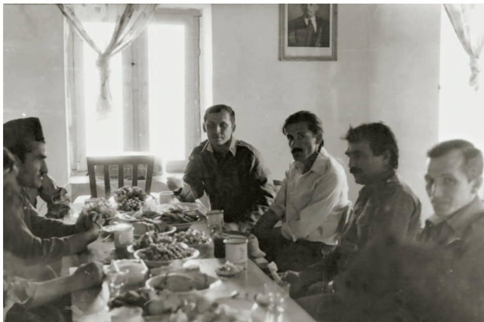
Погранпредставительская встреча с руководством Чахи-Абского улусвольства, начальником отдела МГБ и командиром роты царандоя