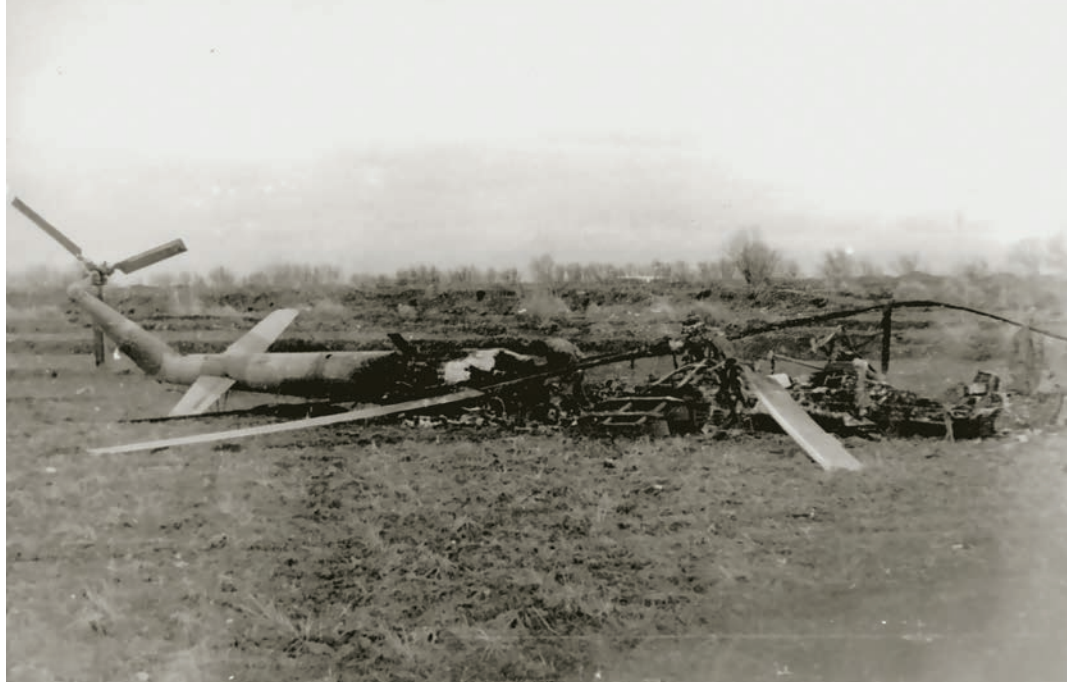
Вертолет, сбитый при блокировании к. Альчин во время высадки ДШМГ (операция «Возмездие»), участок Имам-Сахибской зоны напротив 48-го погранотряда (п. Пяндж)