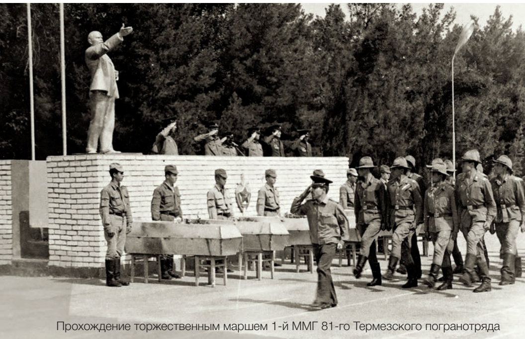
Прохождение торжественным маршем 1-й ММГ 81-го Термезского погранотряда

(было уничтожено 20 бандитов, 11 человек было взято в плен), но кто вернет жизнь молодым людям, полным энергии и сил?