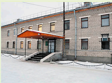
Именная пограничная застава