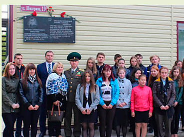
Улица в пгт. Лоухи, Карелия