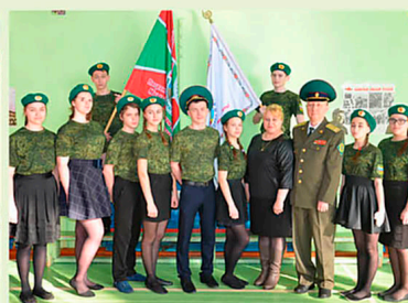
Именной пионерский отряд