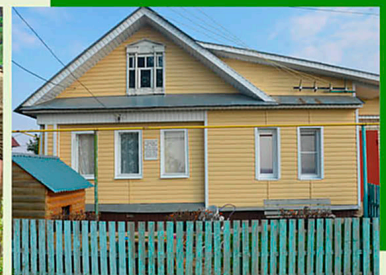
Дом в деревне Ляпуново