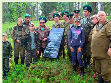
Место боя у озера Касли-Ярви