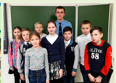
Именной отряд ЮДП