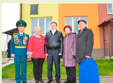
Улица в г. Городце