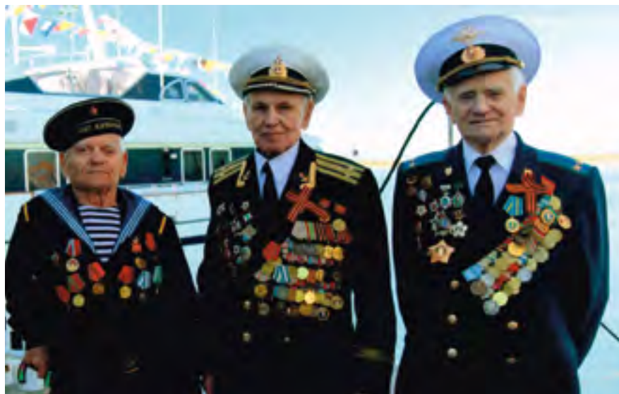
С коллегами по ветеранскому строю