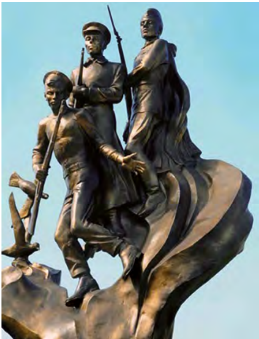
Скульптурная композиция «Пограничный десант» в г. Килия Одесской области

Светлели лица, прибывали силы, И верилось, что через сто преград С победой полк дойдет до Измаила, Но путь к нему вел через Сталинград!