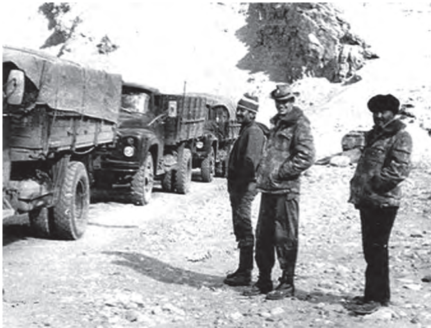
На дорогах Памира

Через день, после проведения воздушной разведки, в район боестолкновения высадилась ДШМГ Восточного округа. В ходе специальной операции бандиты из близлежащих кишлаков, у которых нашли оружие, снаряжение, обмундирование погибших пограничников, были схвачены. Их привезли в Гульхану, допросили и передали службе безопасности Афганистана. Всех, у кого были найдены неопровержимые доказательства участия в засаде, по законам военного времени приговорили к расстрелу.