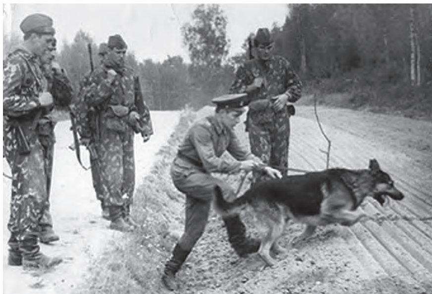
В полевом учебном центре

В нашем дивизионе были курсанты практически со всех советских республик, но коллектив сложился на редкость сплоченный, дружный. Мы до сих пор собираемся в День пограничника