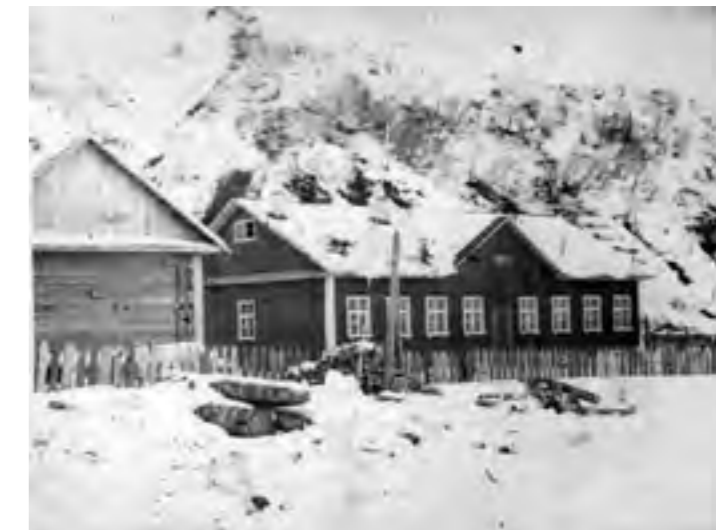
Остров Кунашир. На пограничной заставе «Мечниково»