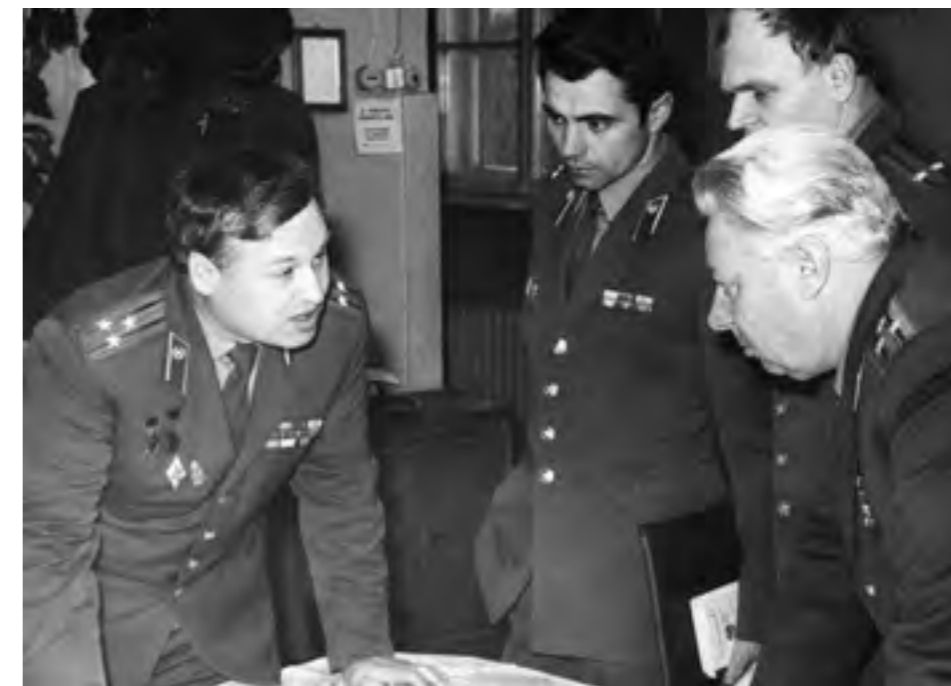
Кафедра ОВД. Подготовка к тактической «летучке»

В этой команде из 20 человек примерно поровну представителей старшего поколения, которые пришли в институт, имея за плечами опыт службы и участия в боевых действиях, и молодежи, в жизненном багаже которой пока в основном теоретические знания и учебные бои. За последние пять лет в коллективе достигнута полная взаимозаменяемость преподавателей: каждый из них в любой момент готов на должном уровне провести любое занятие по тематике кафедры. Профессионализм ее сотрудников настолько высок, что представители войск занятий с ними не проводят, и это единственное подобное исключение в институте.