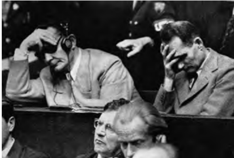
Подсудимый Герман Геринг делал вид, что не понимает, о чем идет речь

Однако государства, противостоящие странам с фашистским режимом и обладавшие вполне достаточными политическими, экономическими и военными возможностями для того, чтобы предотвратить фашистскую экспансию, из-за существующих между ними разобщенности и недоверия, стремились решать свои задачи за счет других государств, прежде всего СССР, только способствовали усилению фашизма и созда-