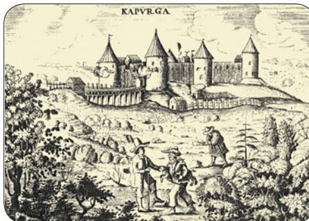
◀ Копорье. Гравюра Олеария. 1634 г.

◀ Копорьская крепость. Северная башня и арочный мост.