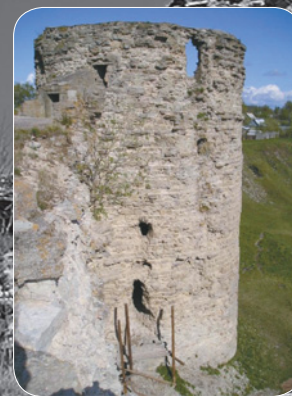
▲ Копорьская крепость. Южная башня.

постные стены толщиной до 5 м достигали общей протяженности 550 м и высоты около 16 м. С восточной стороны, где крепостная стена была самой короткой, располагалась въездная арка. Въездная арка, к которой вел узкий подъемный деревянный мост (в XIX в. был построен каменный арочный мост), имела кованую опускную решетку и деревянные, обитые железом ворота. Кроме того, крепость была усилена 4 круглыми пятиярусными башнями, сильно выступавшими вперед за линию стен для обеспечения флангового обстрела. Три из них были угловыми. В высоту башни достигали 20 м, а их внешний диаметр превышал 13 м.