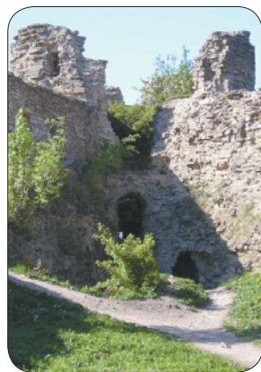
▲ Копорьская крепость. Наугольная башня.

► Сохранившаяся башня Копорьской крепости.